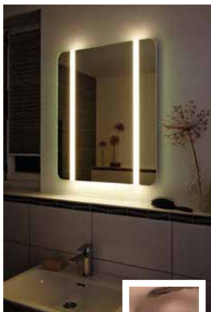
Warmlicht 2700 - 3300 Kelvin