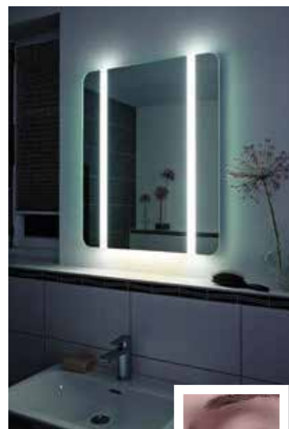
Kaltlicht 4600 - 6500 Kelvin