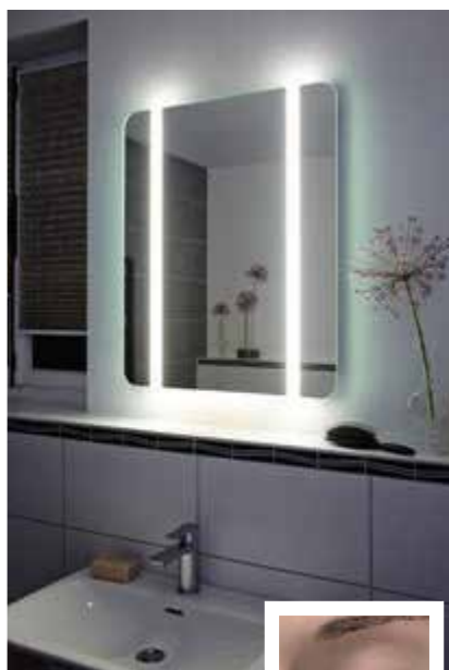
Mischlicht 3400 - 4500 Kelvin